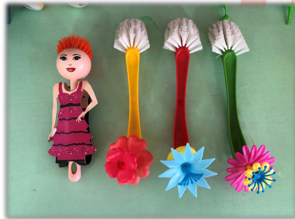
«Щетка Майя» Материал: щетки для мытья.