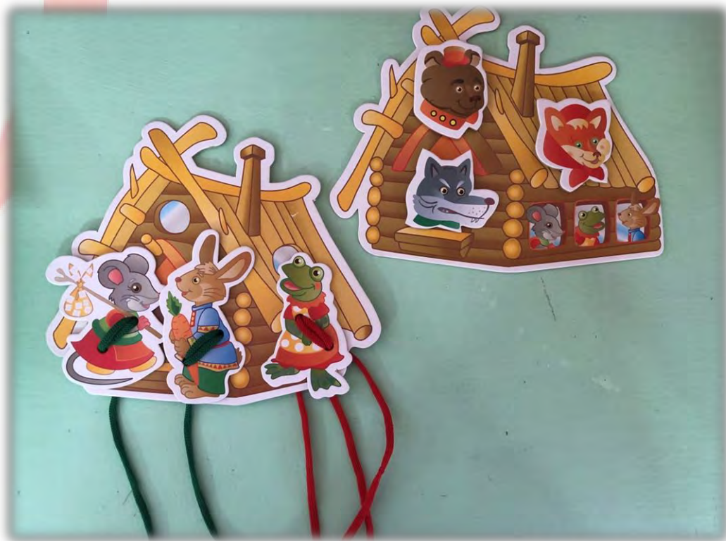
Театр на шнурках «Теремок» Материал: картон, шнурки.