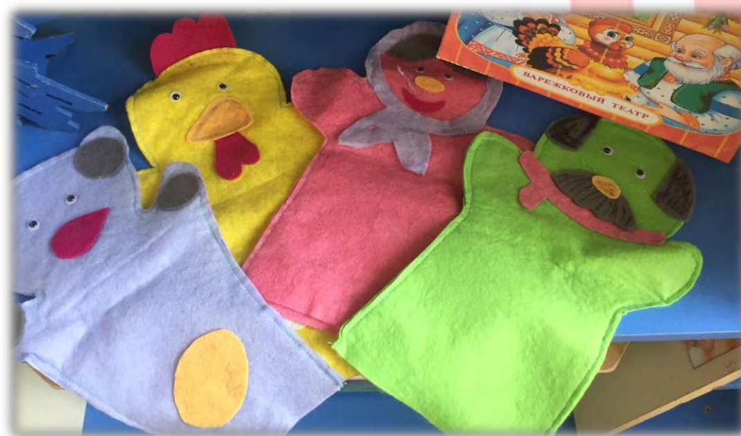
«Куричка Ряба» Материал: ткань, пластиковые глазки.