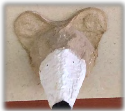
«Лесные друзья» Материал: коробка из под яиц.