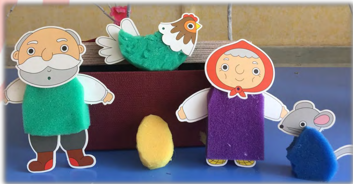
«Куричка Ряба» Материал: губки, картон.