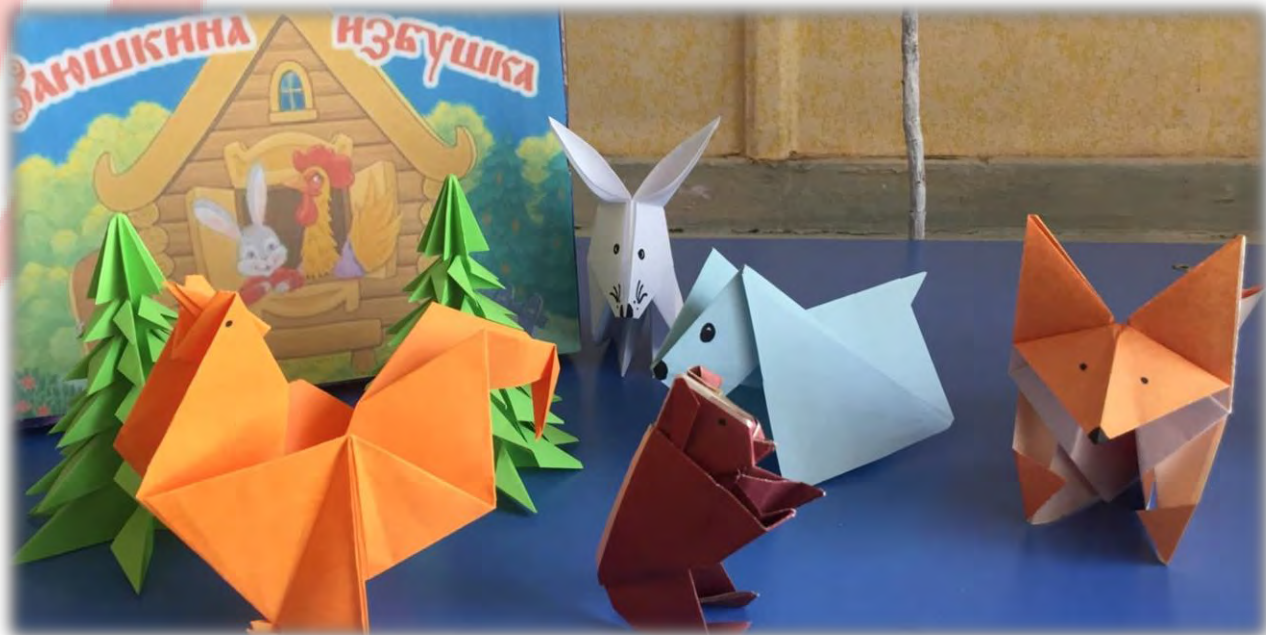
«Заяшкіна ІЗБУШКА» Матэрыял: бумага.