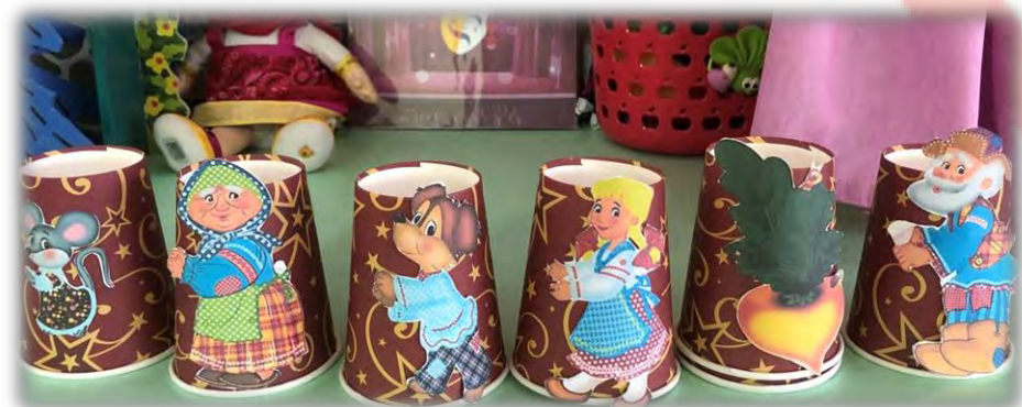
«Репка» Материал: бумажные стаканы.