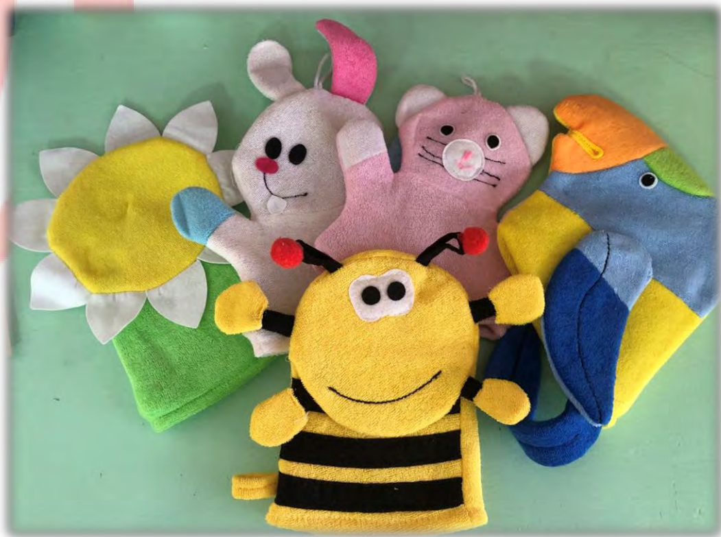
«В огороде» Материал: мочалки.