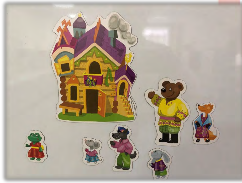
Магнитный театр «Теремок» Материал: магнитная доска.