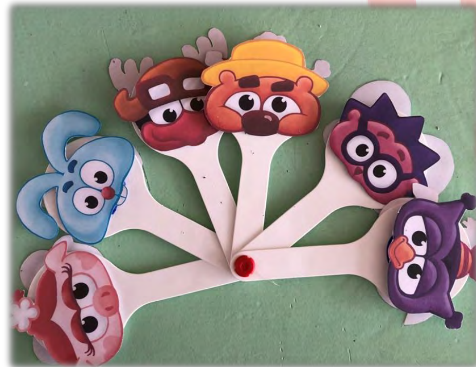
«Смешарики» Матэрыял: веер для счэта, картон.