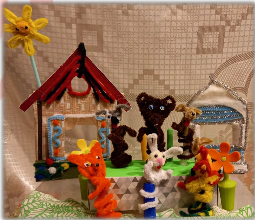
«Лиса и заяц»