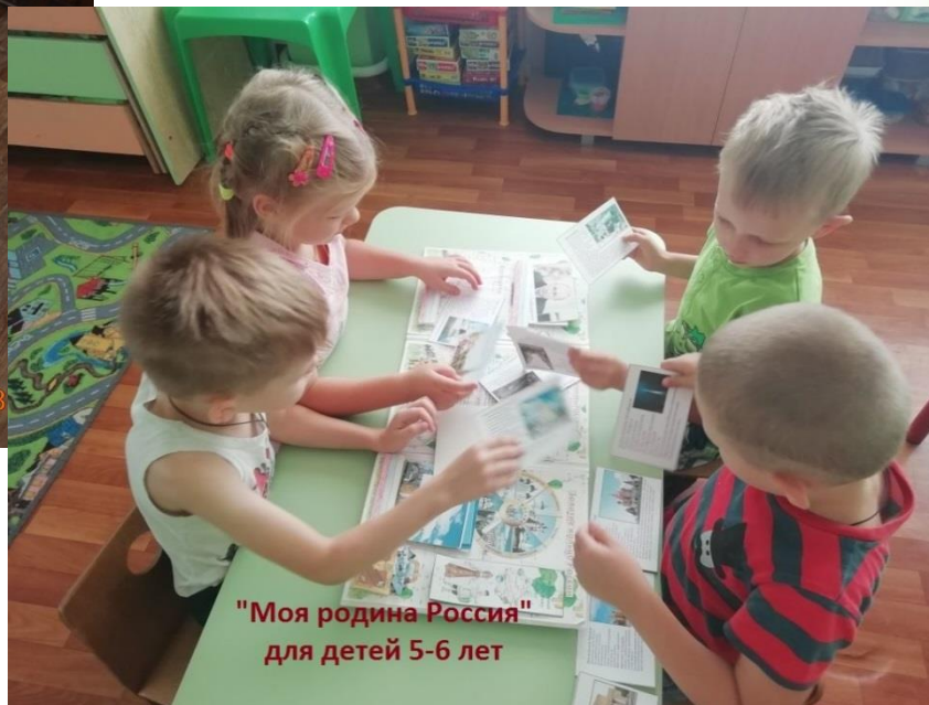
"Моя родина Россия" для детей 5-6 лет