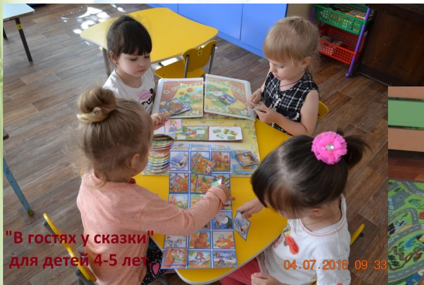
"В гостях у сказки" для детей 4-5 лет